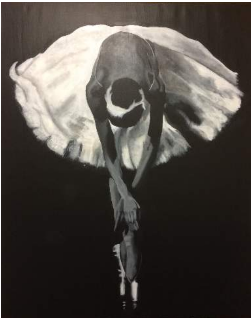
Gribskovmalerne griber penslerne