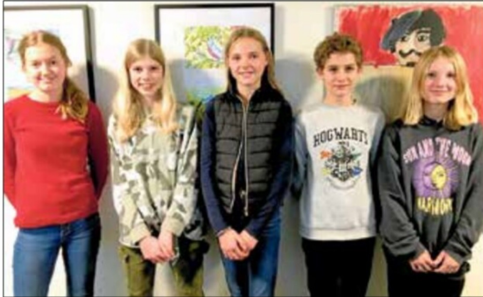
Eleverne fra Farum Billedskole har malet de 10 værker, der nu lyser op på væggene på plejecenter Svanepunktet i Farum.