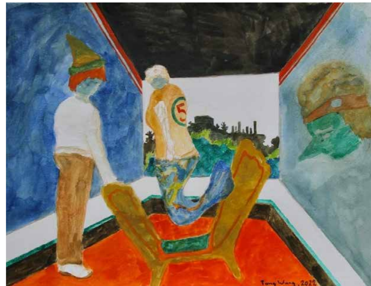
CLOTHES OF THE WATER TONG WANG

Lørdag 1. oktober - 4. november Førniseriing kl. 12.15 i Galleriet